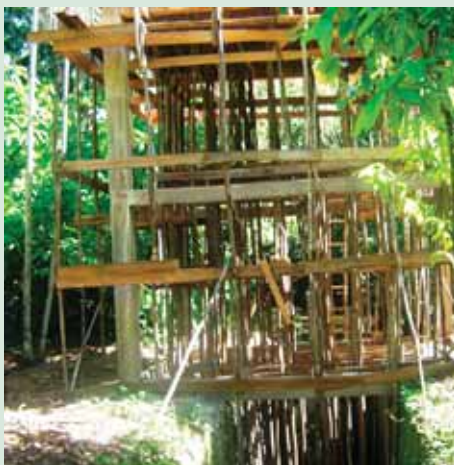
Ruína dos escravos com marcas da intervenção