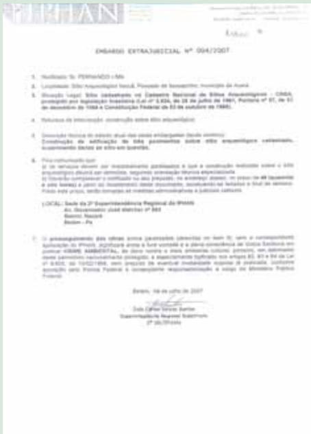
Embargo da obra emitido pelo IPHAN Instituto de Patrimônio Histórico e Artístico Nacional