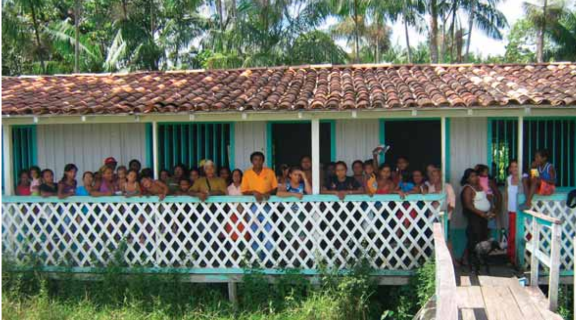
Participantes da oficina realizada pela ASMAMI na Escola Nossa Senhora da Conceição, ilha de Itacoãzinho. 8 julho 2007