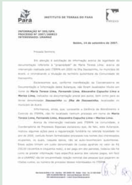
Documento do ITERPA informando a não existência de registro em nome dos Lima