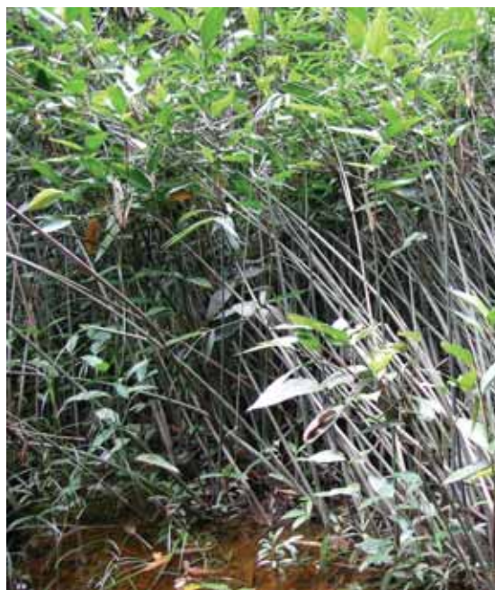
Touceiras de Arumã no igarapé do Dinheiro – Comunidade do Sobrado