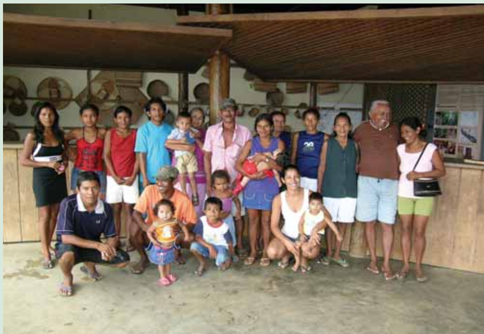
Artesãs e artesãos da AANA com seus filhos durante a realização da oficina de mapas

Ser artesã é ser artista, fazendo o que sai da nossa cabeça virar arte. É ser criativa, gostar de inventar, aprender coisa nova. É gostar do que faz, ajuda na renda da casa e é como uma terapia, a vida tá cheia de problemas e tecendo você esquece.