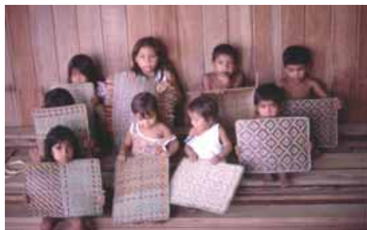
Crianças na Central de Artesanato da AANA