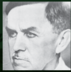
NIMUENDAJU, KURT UNKEL