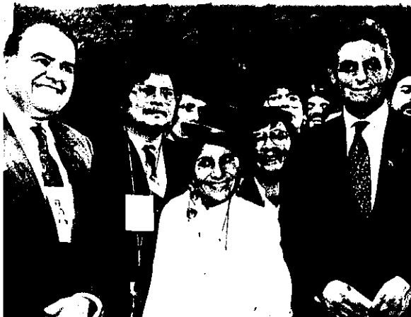
Cumbre de Madrid

Reunidos en Madrid, España, en julio de 1992, en el marco de la Segunda Cumbre Iberoamericana, los jefes de Estado de América Latina, España y Portugal, establecieron el Fondo para el Desarrollo de los Pueblos Indígenas de América Latina y el Caribe. El estímulo para la creación del Fondo surgió de una resolución conjunta de los gobernantes que asistieron a la primera Cumbre Iberoamericana efectuada en Guadalajara, México, en julio de 1991.