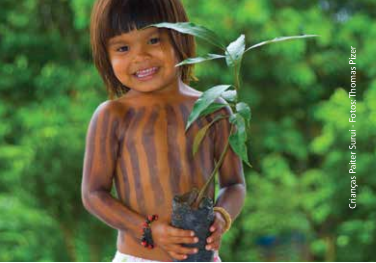
Crianças Paiter Suruí