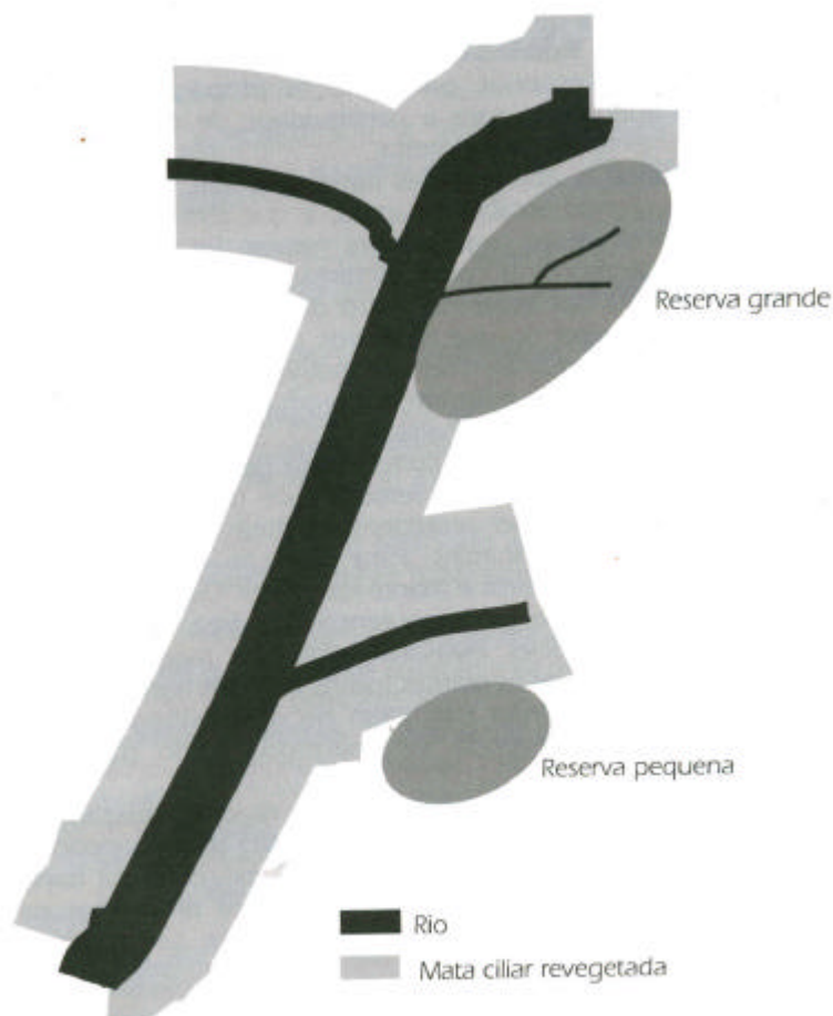
Esquema de corredores de ligação entre reservas de conservação, através da revegetação de matas ciliares na bacia hidrográfica.

Ao dar início à atividade de revegetação em áreas de florestas de proteção, é importante considerar que, através deste trabalho, somente se estará fornecendo os ingredientes iniciais necessários para o início de um processo de restauração da área. A manutenção e proteção das matas, após essa fase, dará condições para que a natureza se encarregue da continuidade do processo.