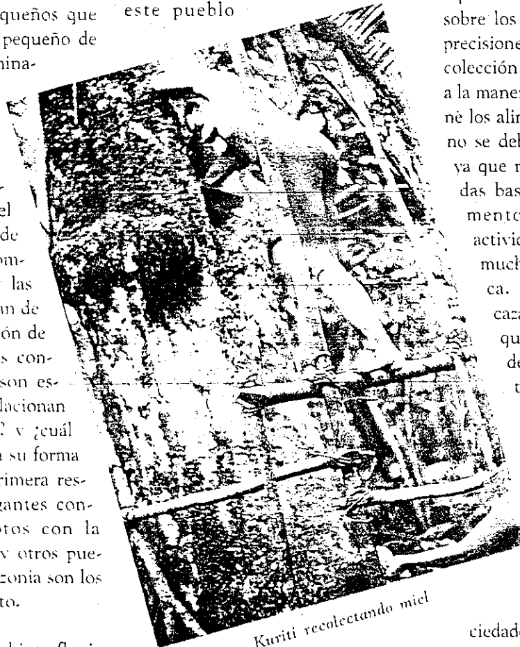
Kuriti recolectando miel

taria de ligera o fuerte ondulación. Su clima según la clasificación de Köppen es tropical lluvioso con una precipitación de 2.500 mm anuales; con un corto período seco de diciembre a marzo, un período de lluvias de abril a noviembre y una temperatura media de 26° C. Actualmente se conoce que este pueblo