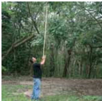
Uso de podão