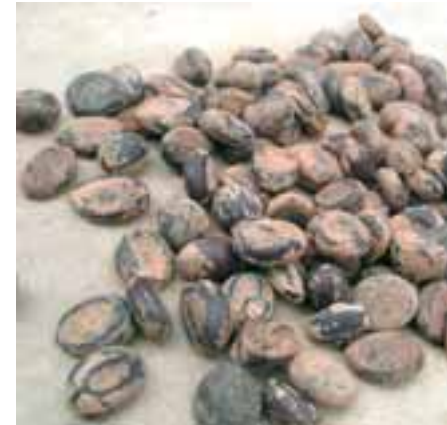
Sementes de jatobá

É importante lembrar que quem atua no setor de sementes e mudas fica obrigado a obedecer a legislação em vigor, em destaque a Lei Nº 10.711, de 5 de agosto de 2003, e o Decreto Nº 5.153, de 23 de julho de 2004, que a regulamenta.