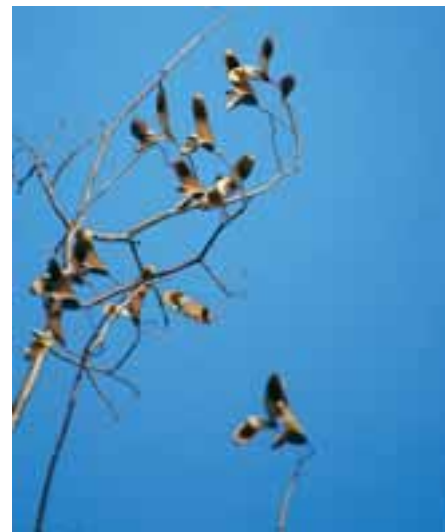
Frutos maduros do cumaru