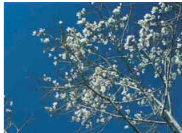
Floração da barriguda