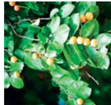
Frutos do juazeiro