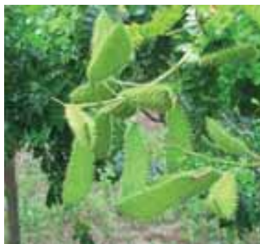
Frutos verdes do pau-brasil