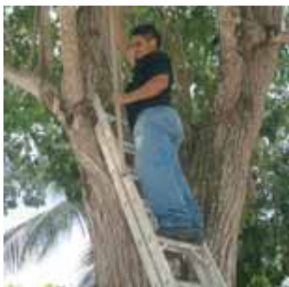
Uso de escada

A maneira de colher as sementes vai depender da forma e da altura da árvore, do tipo de casca, da presença de espinhos, do tipo do terreno, do equipamento disponível e do conhecimento técnico do pessoal envolvido na colheita. Em qualquer caso, sempre que for necessária a escalada da árvore, deve-se recorrer a uma pessoa capacitada que sempre utilizará equipamentos de segurança.