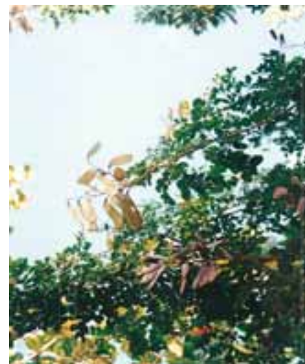
Frutos em processo de maturação da catingueira