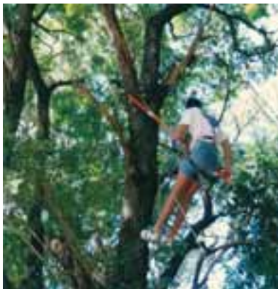
Equipamento de alpinismo