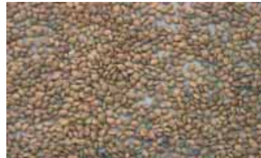
Sementes de jucá

Recalcitrantes – aquelas que perdem rapidamente a sua viabilidade, não suportando secagem e armazenamento. Portanto, devem ser semeadas o mais rápido possível. Exemplo: pau-brasil, mangaba, seringueira, mangueira e feijão bravo.