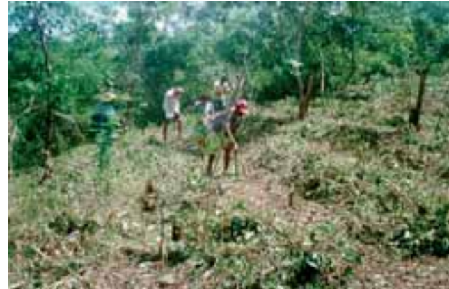
Implantação de sistema agroflorestal