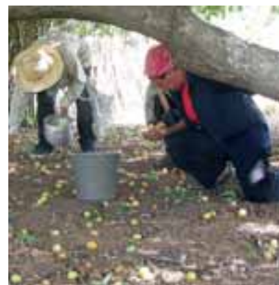
Coleta do umbu no chão