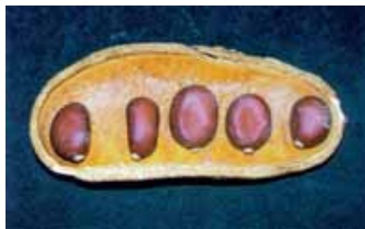
Fruto e sementes do jatobá