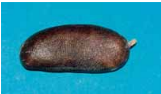
Fruto maduro do jatobá

Os frutos, depois de colhidos, deverão receber cuidados especiais para que não sejam contaminados por insetos ou doenças que possam prejudicar a semente.