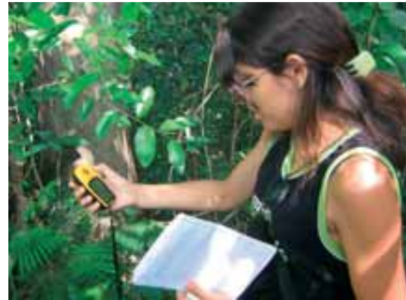
Marcação de matriz com GPS

Após a marcação das matrizes, devem ser feitas visitas periódicas às árvores selecionadas para anotação do período de início da floração, da frutificação e do amadurecimento dos frutos. Recomenda-se que este procedimento seja repetido pelo menos uma vez por mês durante os dois primeiros anos de coleta.