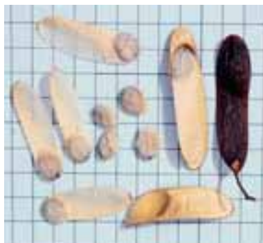
Sementes e frutos do cumaru