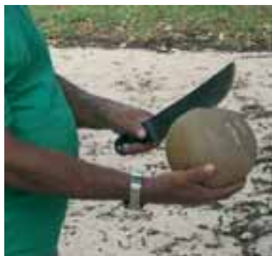
Uso de facão para extração de sementes