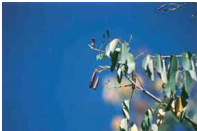
Fruto do cumaru