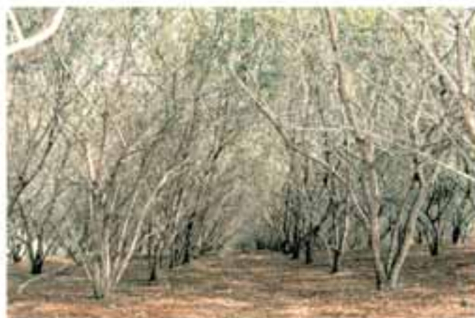
Plantio de sabiá