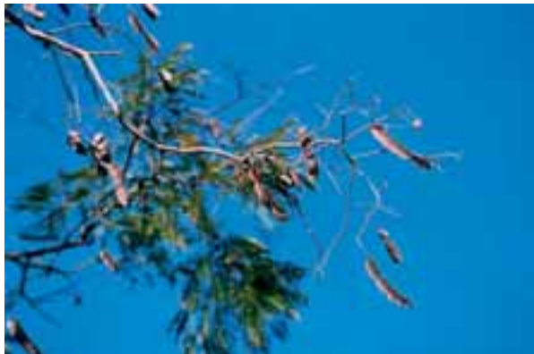
Frutos secos de angico