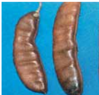
Fruto maduro do jucá

Para os frutos secos que não se abrem naturalmente, são utilizados facas, tesouras, facões e até mesmo o machado. Para algumas espécies que apresentam esta característica, como o jucá, a Floresta Nacional de Nísia Floresta vem utilizando com sucesso o pilão caseiro. É preciso ter bastante cuidado nesse método, pois as sementes poderão ser danificadas caso o esforço utilizado seja superior ao necessário na separação da semente do fruto.