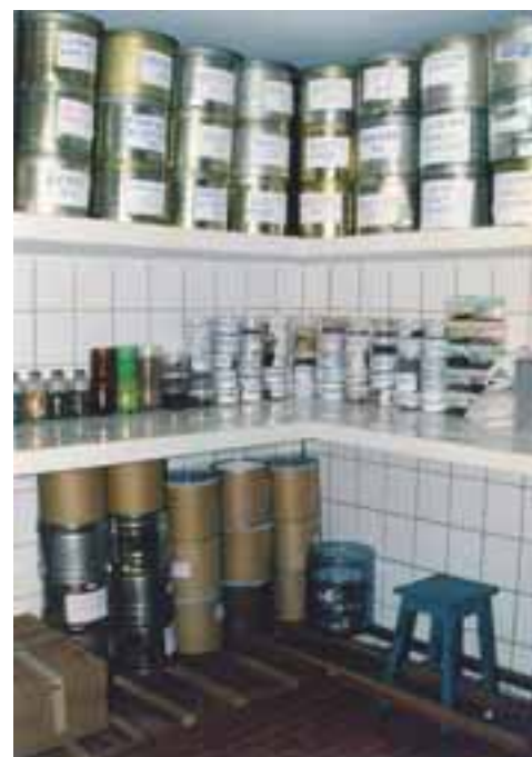
Recipientes utilizados na Câmara Seca da Flona de Nísia Floresta - RN

As sementes podem ser armazenadas em diferentes tipos de embalagens. São usados: sacos plásticos, de papel, de lona, de aniagem, juta ou pano. Podem ser usados também latas de alumínio, quando bem vedadas, vidros (como os de conserva) e embalagens de plástico.