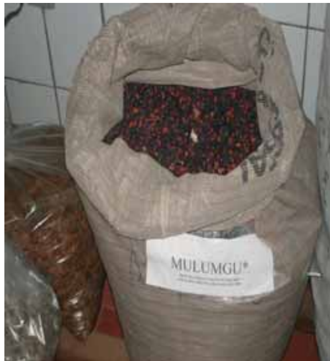
Lote de sementes de mulungu

LOTE é uma determinada quantidade de sementes da mesma espécie, colhidas na mesma época, em várias árvores, na mesma área ou em áreas diferentes da mesma região.