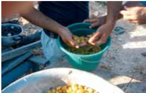
Beneficiamento de sementes

Quando a polpa é muito resistente, os frutos podem ficar dentro d'água por um período de 12 a 24 horas, sendo despolpados em seguida.