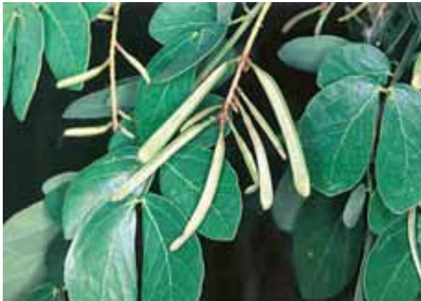
Frutos verdes do sabiá