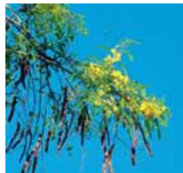
Frutos do angico