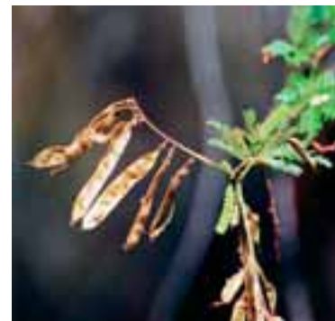
Frutos secos da jurema-preta