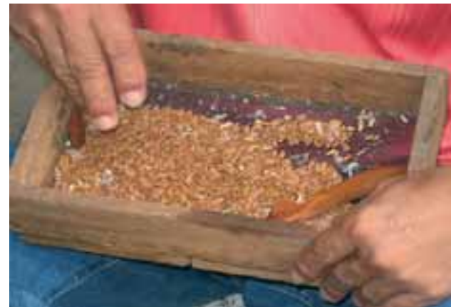
Limpeza manual de sementes com utilização de peneiras