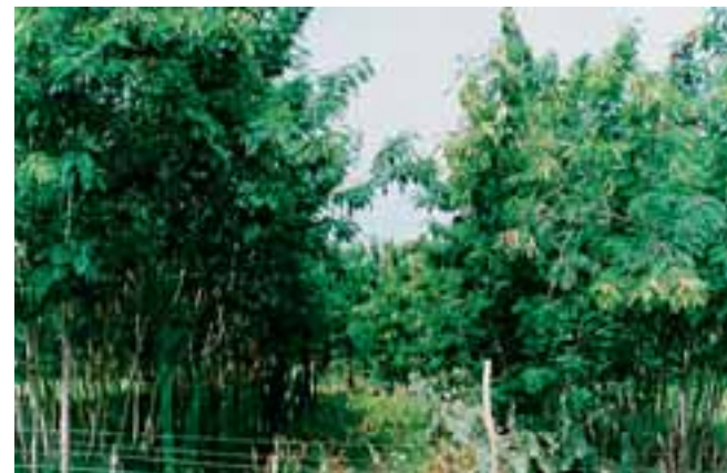
Sistema silvopastoril implantado