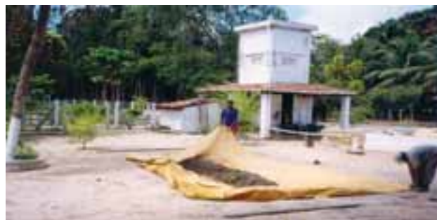
Pátio de secagem com utilização de lona

Pátio de secagem nada mais é do que um terreiro, preferencialmente cimentado ou de terra batida. Do ponto de vista econômico, esta é a melhor forma de secagem das sementes, uma vez que utiliza o sol e/ou o vento.