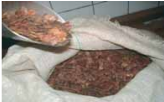
Sementes de sabiá

Ortodoxas – aquelas que podem ser secadas e armazenadas por um longo período de tempo, a baixas temperaturas, sem perder sua capacidade de germinar. Este é o caso da maioria das espécies florestais tropicais. Como exemplos deste grupo estão as sementes de sabiá, tamboril, jucá e cumaru.