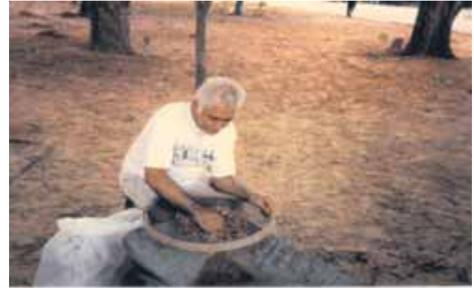
Catação manual de sementes de sabiá

Para retirar aqueles materiais indesejáveis, pode-se utilizar uma máquina de ar e peneira. No entanto, essa prática é mais comum em espécies agrícolas de alto valor comercial. Para as espécies florestais, principalmente as nativas, é mais comum utilizar peneiras ou fazer a catação de forma manual desses materiais.