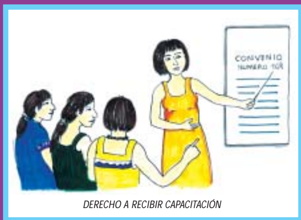
DERECHO A RECIBIR CAPACITACIÓN

¿Podemos decidir los lugares a donde desplazarnos?