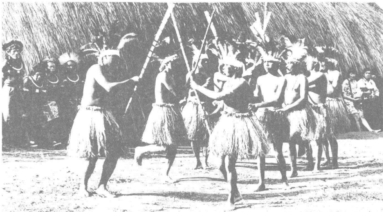
INDIOS TERENA - A Dança da Terra ALDEIA KARI-OCA - RIO/92