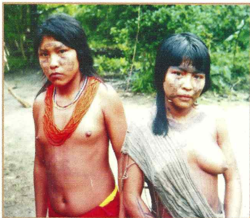
WAIÃPI (AP)

Até agora já foram desenvolvidas parcerias com as seguintes organizações: