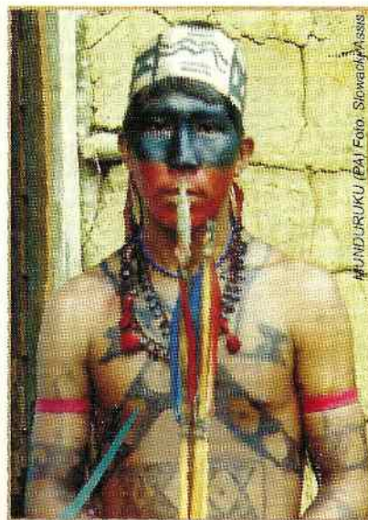
MUNDURUKU (PA)

Secretaria Técnica do PPTAL FUNDAÇÃO NACIONAL DO ÍNDIO- FUNAI 702/ 902 SUL EDIFÍCIO LEX TERCEIRO ANDAR. CEP 70390-025 BRASÍLIA- DF TEL: 0XX61 - 226 750 e-mail: Pptal@funai.gov.br