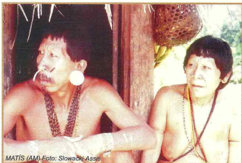
MATÍS (AM)

APINA - Conselho das Aldeias Waiãpi: VIGILÂNCIA