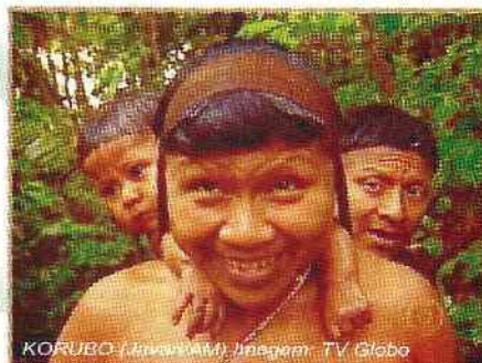
KORUBO (Jivaro/AM)