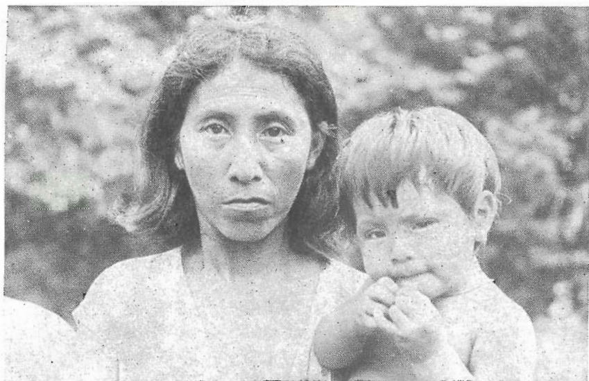
a) Tipos Anambé