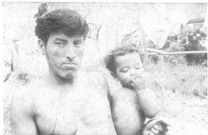
b) Tipos Anambé (Foto E. Arnaud, 1968)