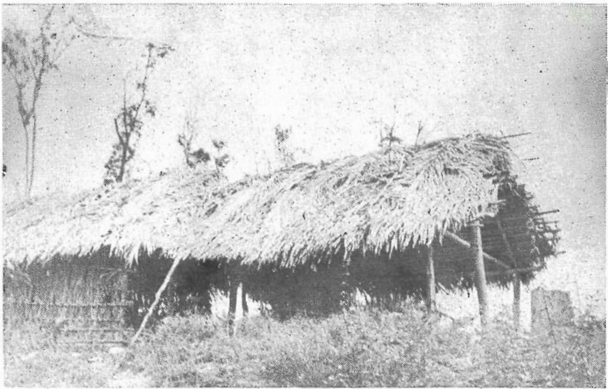
b) Maloca Anambé (Foto E. Arnaud, 1968)