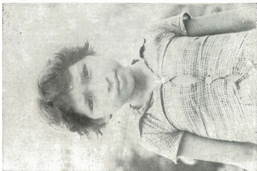
Tipos Anambé (Fotos E. Galvão, 1968)