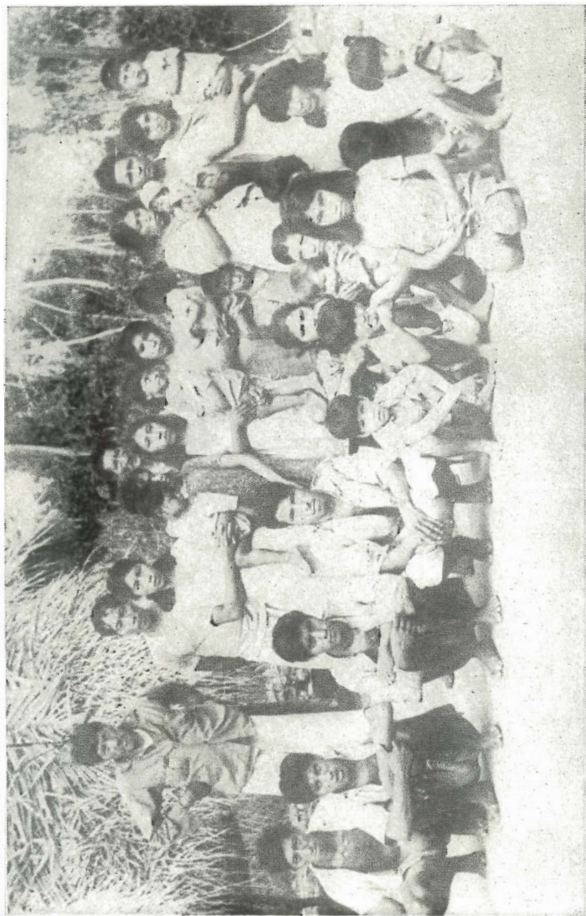
Grupo-local Anambé