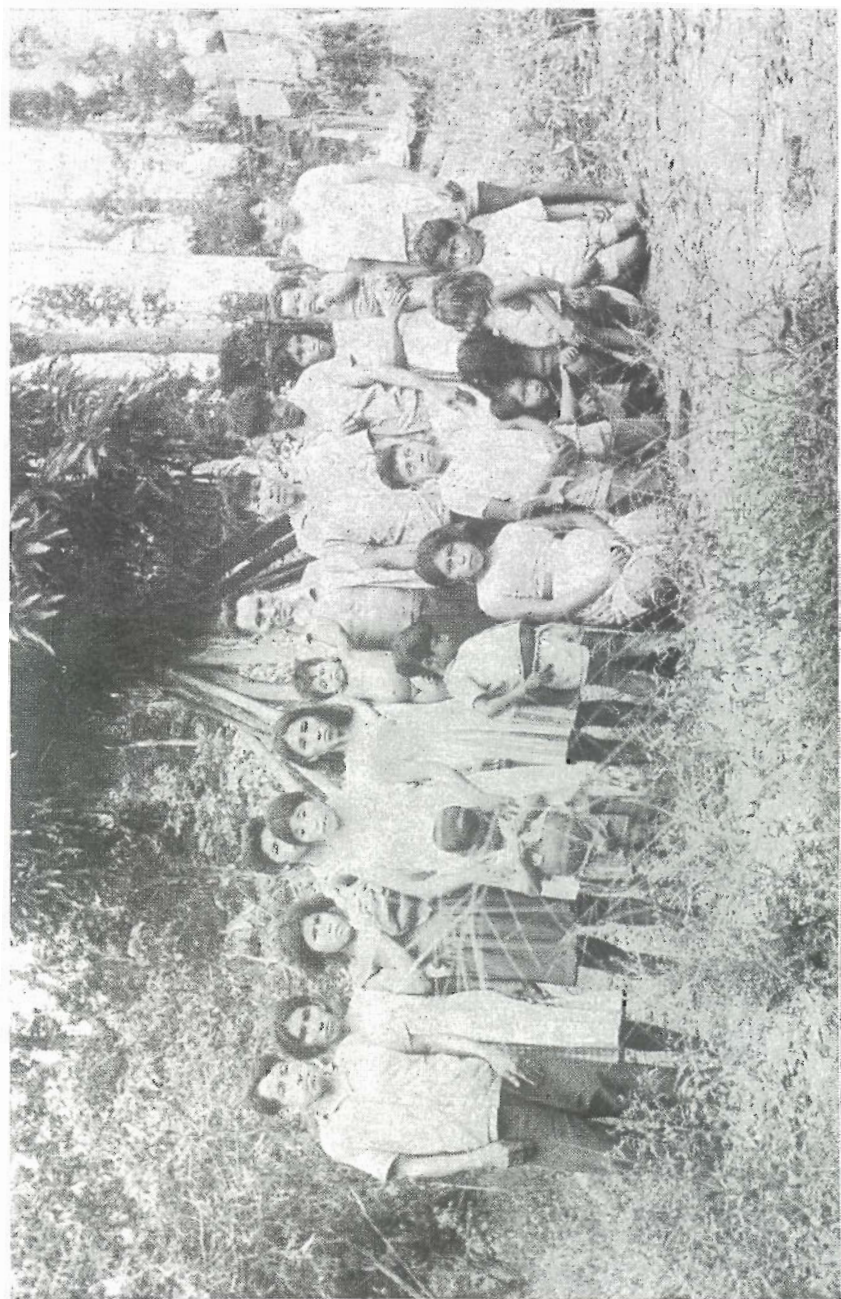
Remanescentes Anambé (Foto E. Arnaud, 1968)