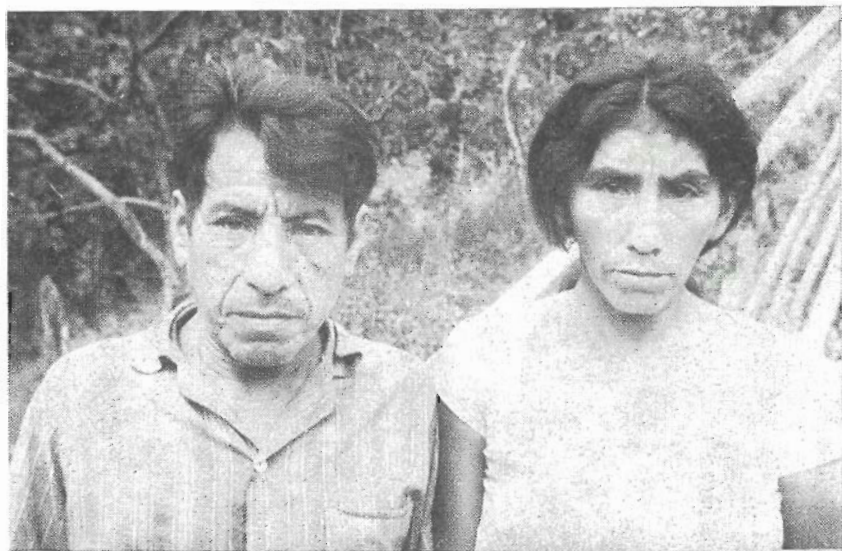
b) Tipos Anambé (Foto E. Arnaud, 1968)