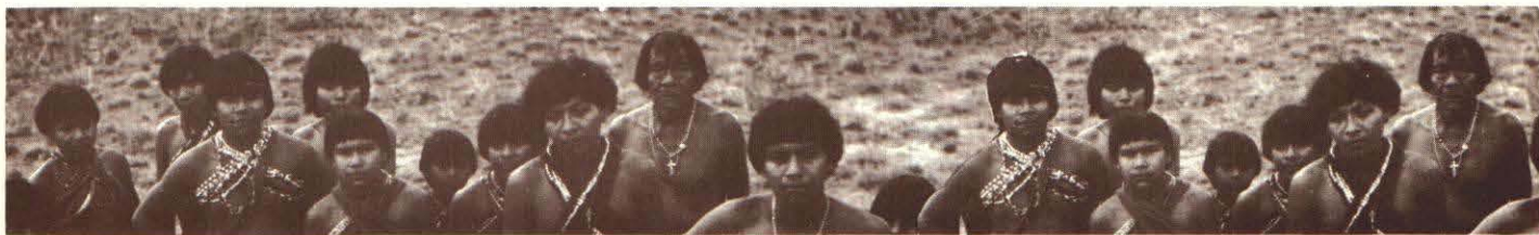
POBLACION INDIGENA POR SEXO, SEGUN ENTIDAD FEDERAL, 1992

Es importante destacar que el censo de la etnia Wayuu se realizó simultáneamente en Venezuela y Colombia, en virtud de un acuerdo suscrito entre los presidentes de ambos países, cuya instrumentación estuvo a cargo de la OCEI y Corpozulia, por Venezuela, y el DANE y Corpoguajira, por Colombia. Los resultados que aquí se ofrecen corresponden a los integrantes de esta etnia censados en territorio venezolano.