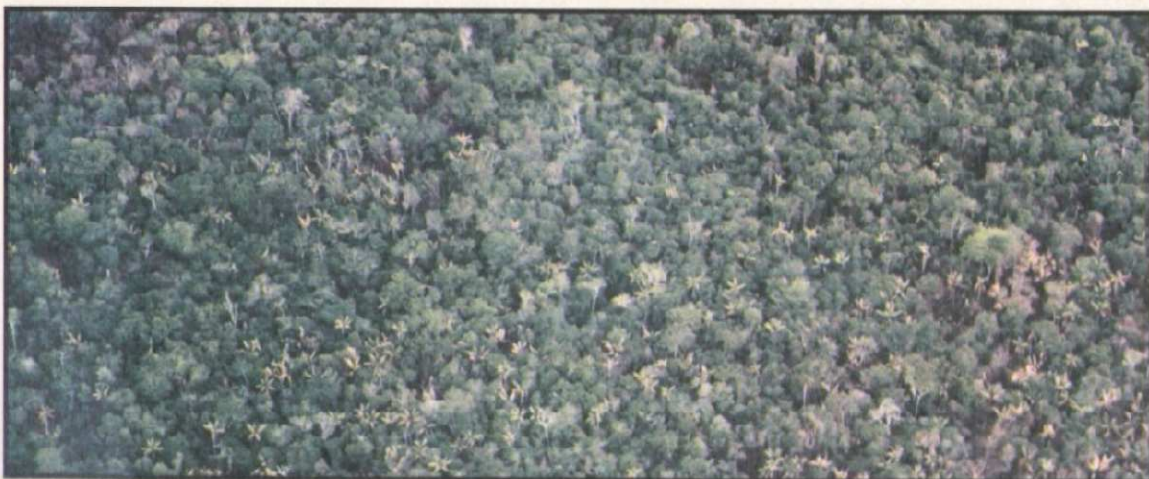
Figura 6. Área próxima à serra do Cantá com alta concentração de palmeirais de inajá ( Attalea maripa )

Os efeitos sobre o ciclo hidrológico decorrem da importância da floresta para a manutenção do equilíbrio na distribuição de chuvas. Estudo de Eneas Salati mostrou que metade da água que circula nos sistemas florestais da Amazônia é reaproveitada ali mesmo: as grandes massas de evaporação e transpiração das plantas mantêm-se na região e retornam em forma de precipitação. Além disso, estima-se que a água que circula na Amazônia seja responsável por boa parte das chuvas que ocorrem em toda a América do Sul. Assim, desmatamentos e