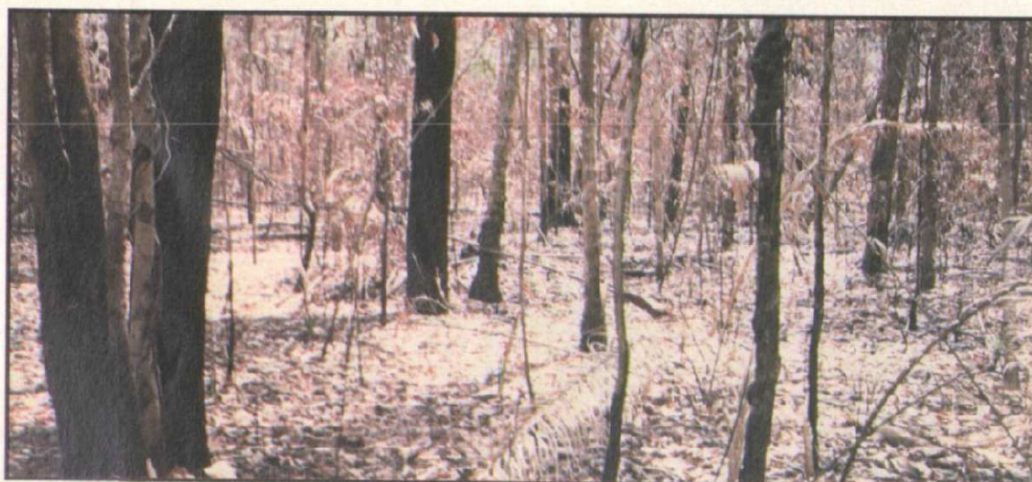
Figura 3. Aspecto geral do sub-bosque de um trecho da floresta amazônica após a passagem do fogo

Os incêndios florestais em Roraima foram favorecidos pelo excesso de material combustível (biomassa vegetal morta sobre o solo), pela reduzida umidade desse material (abaixo de 10%, tornando-o mais inflamável), e pela presença de uma fonte inicial de ignição. As duas primeiras condições podem ser explicadas pelo forte evento El Niño, pois, a grosso modo, quanto maior o estresse causado pela seca, maior o volume de massa liberado pela vegetação como forma de defesa fisiológica. A terceira condição – a fonte de ignição – é dada pela forma de preparo inicial do solo para a implantação de culturas agrícolas ou pastagens.