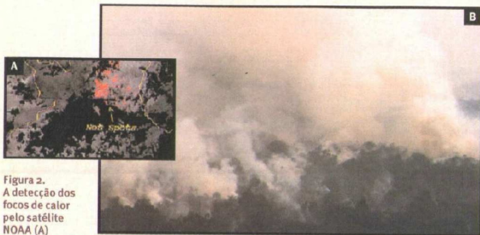
Figura 2. A detecção dos focos de calor pelo satélite NOAA (A) permitiu acompanhar as linhas de fogo, fotografadas de perto (B) próximas da reserva indígena Yanomami

O método de quantificação das áreas queimadas consistiu na combinação de levantamentos aéreos (sobrevôos), trabalhos de campo e análises de imagens dos satélites Landsat e NOAA. O intervalo de incerteza em relação à área de florestas efetivamente queimada deve-se a estimativas sobre o fogo rasteiro, que avança sem muita intensidade no solo e tem efeitos pouco aparentes nas copas das árvores. Por isso, nem sempre é percebido por sobrevôos ou imagens de satélite, mas apenas por pesquisas de campo.