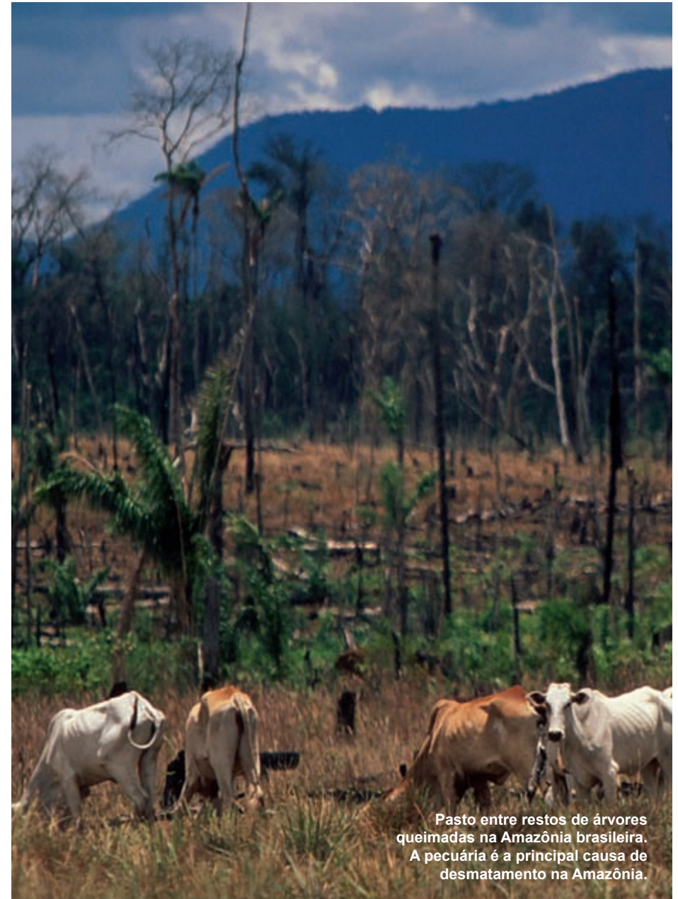
Pasto entre restos de árvores queimadas na Amazônia brasileira. A pecuária é a principal causa de desmatamento na Amazônia.

A transformação econômica da Amazônia está ganhando impulso e mesmo com a intensificação dessas pressões, contata-se que a Amazônia desem-