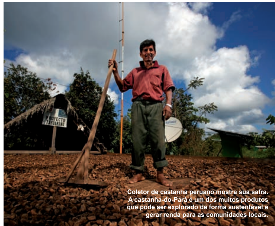
Coletor de castanha peruano mostra sua safra. A castanha-do-Pará é um dos muitos produtos que pode ser explorado de forma sustentável e gerar renda para as comunidades locais.

O futuro da Amazônia depende do manejo sustentável dos ecossistemas e serviços que oferece. Os governos da região reconhecem a importância do desenvolvimento sustentável na Amazônia para a biodiversidade, os meios de subsistência e a água doce, e estão ativamente mobilizados no trabalho de conservação dos ecossistemas. Eles elaboraram estratégias nacionais de desenvolvimento sustentável, criaram agências de proteção ambiental, legislaram para proteger o meio ambiente e firmaram numerosos convênios e tratados ambientais em nível internacional e regional.