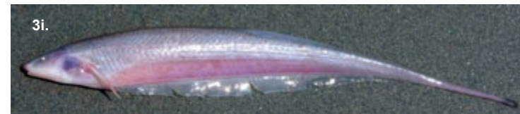
3a. Otocinclus cocama 3b. Apistogramma baenschi 3c. Apistogramma baenschi 3d. Compsaraia samueli 3e. Hypancistrus contradens 3f. Irاندuba capapretum 3g. Aphyocharax yekwanae 3h. Phreatobius dracunculus 3i. Compsaraia samueli