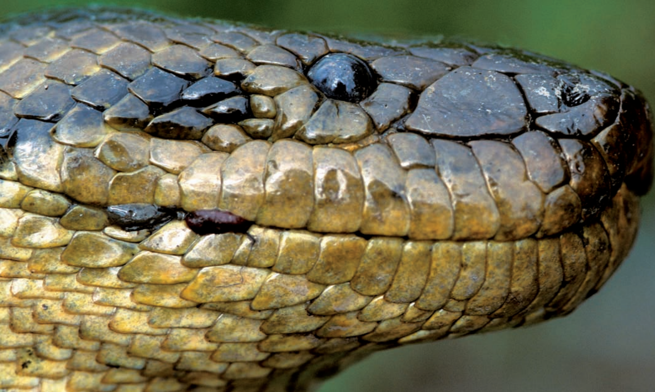
Sucuri-boliviana ( Eunectes beniensis )