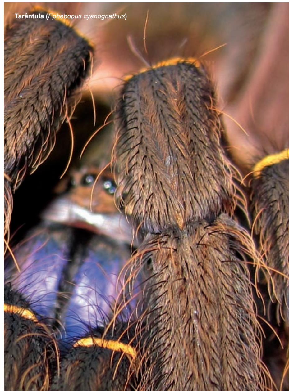
Tarântula ( Ephebopus cyanognathus )

Na Amazônia, o todo é mais do que a soma das partes e o desenvolvimento de uma visão de conservação vai ajudar a manter a integridade e funcionalidade da região, além de sua resiliência às ameaças crescentes, em especial às mudanças climáticas.