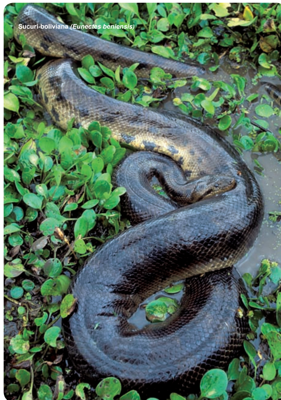
Sucuri-boliviana ( Eunectes beniensis )

Todas as sucuis são serpentes primordialmente aquáticas, com olhos pequenos em posição dorsal e cabeça relativamente estreita. Esses animais se valem predominantemente da emboscada – capturando, sufocando e devorando um variado leque de presas; quase certamente qualquer coisa que consigam dominar, inclusive anfíbios e répteis aquáticos, mamíferos, aves e também peixes. Indivíduos maiores podem comer jacarés grandes e mamíferos do porte de capivaras, antas e onças.