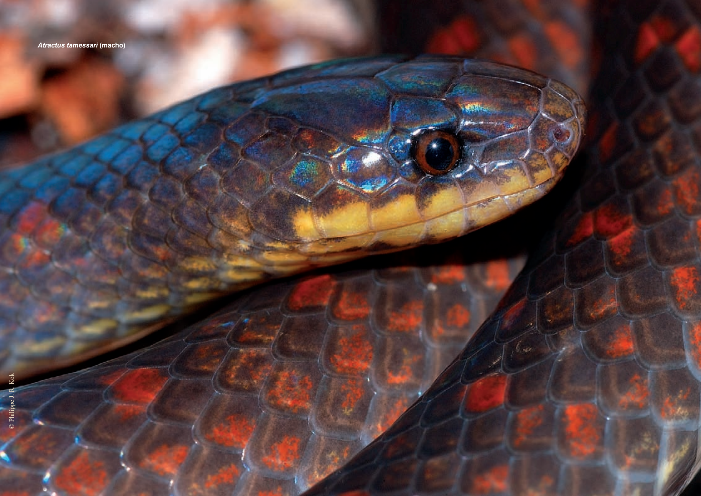
Atractus tamessari (macho)