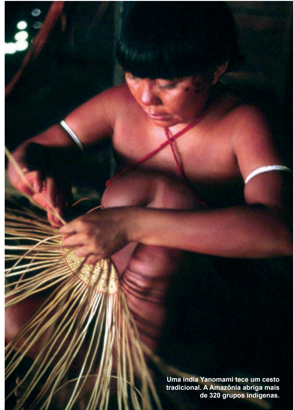
Uma índia Yanomami tece um cesto tradicional. A Amazônia abriga mais de 320 grupos indígenas.

Na Amazônia, o todo é mais do que a soma das partes, e o desenvolvimento de uma visão de conservação vai ajudar a manter a integridade, funcionalidade e resiliência da Amazônia, que agora se depara com ameaças crescentes, em especial as mudanças climáticas.