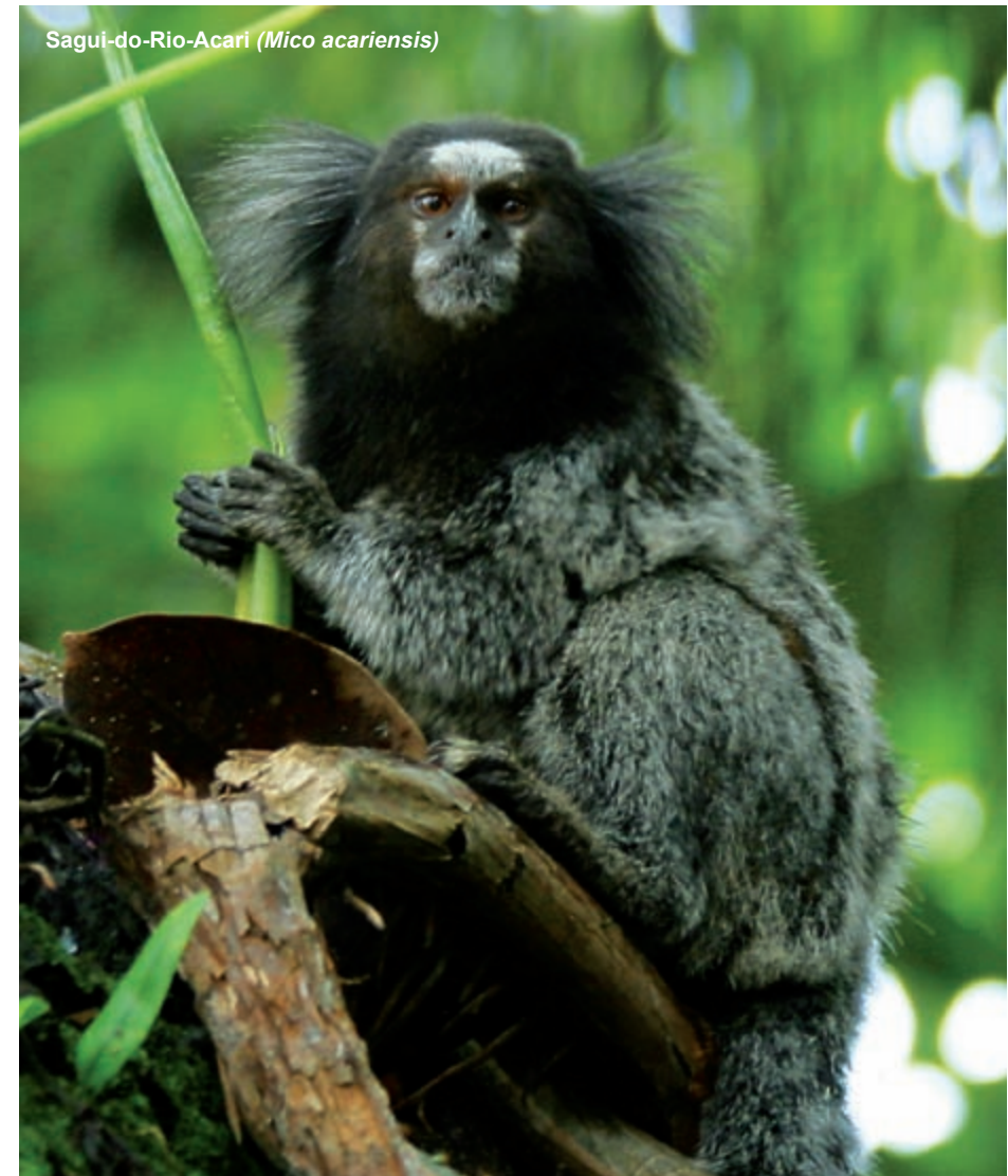
Sagui-do-Rio-Acari ( Mico acariensis )

Também foram descobertas sete novas espécies de macacos durante o período. Um habitante da floresta amazônica de baixada, o sagui-do-rio-acari ( Mico acariensis ), descoberto em 2000, é uma espécie de sagui endêmica do Brasil 68 . Estava originalmente sendo mantido como animal de estimação por habitantes de um pequeno povoado perto do rio Acari, na Amazônia central brasileira. A espécie pesa 420 g, tem 24 cm de altura, com comprimento total de 35 cm, e apresenta coloração laranja marcante na região lombar, partes inferiores do corpo, pernas e base da cauda. Essa espécie ocorre em uma região relativamente remota da Amazônia, distante de distúrbios humanos significativos. Como a espécie não foi estudada na natureza, atualmente não há informações confiáveis sobre seu status populacional ou principais ameaças.