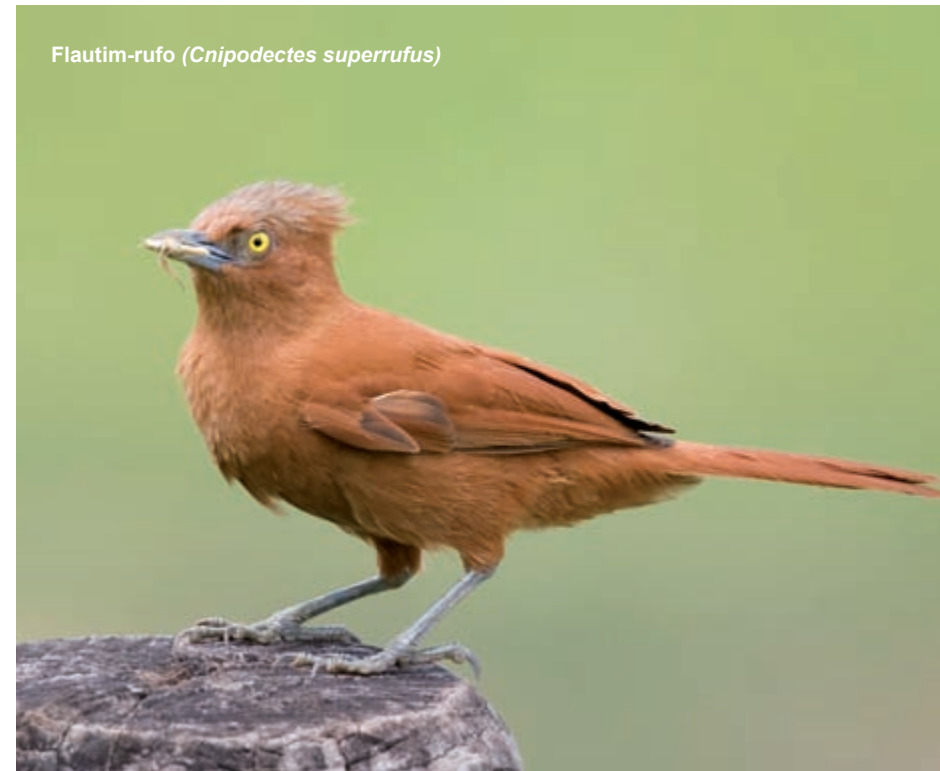
Flautim-rufo ( Cnipodectes superrufus )

Alguns cientistas estão preocupados não apenas com a conservação da avifauna amazônica ameaçada e recém-descrita, mas principalmente com as espécies esquecidas 65 . Muitas espécies dependem de ornitólogos e de equipes de museus sul-americanos com financiamento deficiente, que dedicam tempo e recursos pessoais para descrever oficialmente as aves. Enquanto isso, há também uma enorme demanda por estudos ecológicos para melhor compreender e definir a situação de ameaça de um grande número de espécies consideradas “deficientes de dados”. Como uma corrida contra o tempo, a pesquisa ornitológica para descrever corretamente a avifauna mais rica e complexa do planeta não está acompanhando o ritmo de desenvolvimento na região, de modo que muitas espécies ainda nem descritas já estão ameaçadas de extinção 66 .