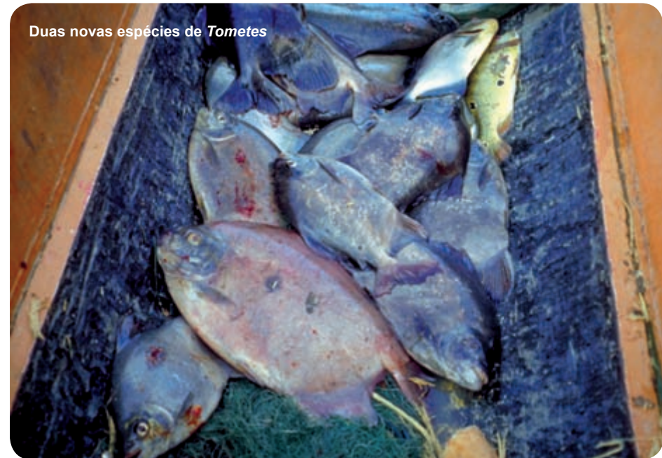
Duas novas espécies de Tometes