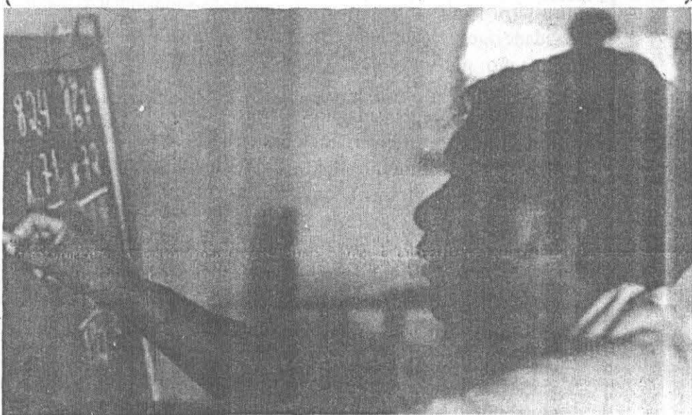
...de educação são precárias

Essas afirmações foram feitas ontem pela Coiab em um fax enviado à essa editoria.