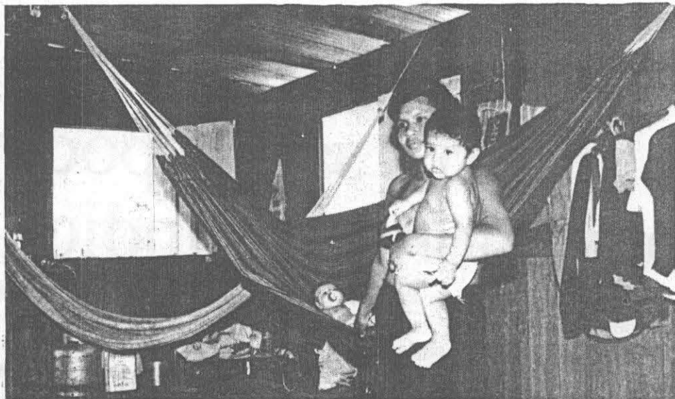
Sistema de saúde nas aldeias e...

Pelo menos 12 índios morreram vitimados por malária e hepatite do tipo B na região do Vale do Javari nos últimos dias e mais de 26 yanomamis morreram, em Roraima, de janeiro a agosto, em consequência da falta de assistência. Em outras regiões da Amazônia o abandono na área de saúde pode resultar em novas tragédias.