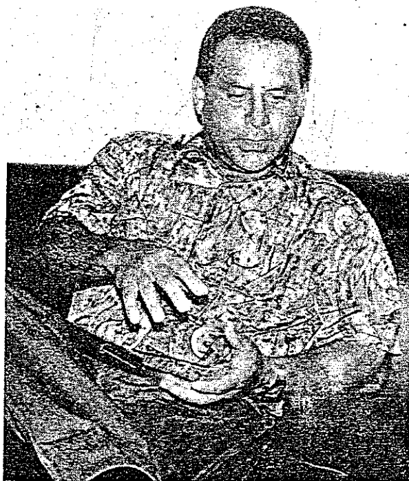
Marcos Monteiro, prefeito de Atalaia: calamidade

Benjamin Constant — A população de Benjamin Constant está sendo ameaçada pelo grande número