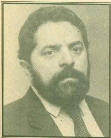
Luis Inácio Lula da Silva

"A cultura negra é uma das pedras fundamentais para enterdermos a alma da sociedade brasileira. Somente com o fim do preconceito e da discriminação racial poderemos dizer que o Brasil é uma verdadeira democracia. Quero parabenizar as entidades que organizam a Marcha sobre Brasília. Trata-se de uma atitude histórica que mostra que o povo brasileiro está atento à importância de suas raízes.